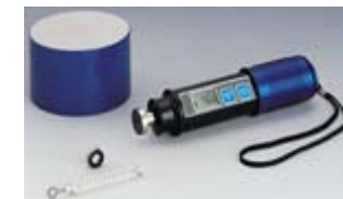
Dureté digitale : HV, HB, HRC