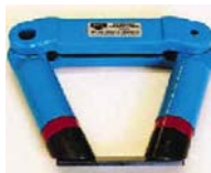
Aimant permanent 18 kg