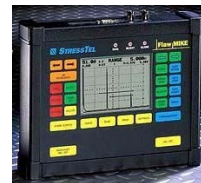
Le « Flaw Mike »

Mesureur d'épaisseur avec vu « A Scan » et « B Scan ».